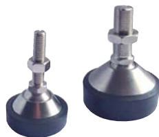
Pied - Foot LFC